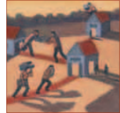
Illustrations : Aude Samama

Ce dossier propose une réflexion concrète sur les enjeux de l'information et de la documentation dans le paysage de la santé publique, tant au plan national que local, et plus particulièrement dans le champ de la promotion de la santé. Il est en effet devenu incontournable d'organiser et de partager les informations, d'avoir accès à une sélection pertinente de données et de capitaliser les connaissances pour mettre en œuvre une politique de santé publique ou pour nourrir les actions de terrain. À l'heure où les questions à traiter se complexifient, où la gouvernance par la preuve scientifique s'impose, où le web donne accès à un nombre croissant d'informations, ce dossier a pour but d'apporter des connaissances et des ressources.